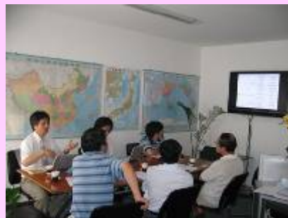
真剣なディスカッション