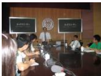
中国人民大学での留学説明会

27日、九州大学経済学府留学生説明会は中国人民大学逸夫会議中心にて開催。夏休みにも関わらず、数十人の学生が会場に集まり、九州大学、九州大学経済学府、および経済システム専攻と経済工学専攻に関する紹介を熱心に聞いた後、さまざまな質問を寄せ、九大経済学府留学への大きな関心を示している。