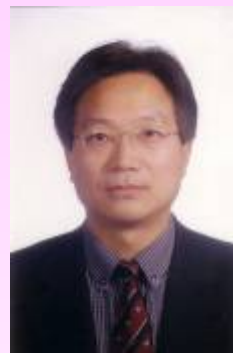
細事まできちんと遣りこなす

1954年 生まれ 1974年—1979年 陝西省華山冶金医学専科学校附属病院 1979年—1984年 華西医科大学医学系 1984年—1993年 北京中日友好病院普通外科 1993年—1998年 日本九州大学医学系研究科大学院 1998年—今 北京中日友好病院普通外科