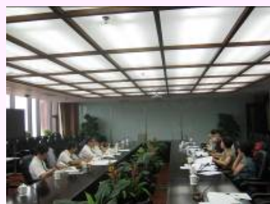
人民大学での意見交換